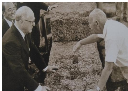
Avery Brundage y Carl Diem, Olympia 1961

Debido a la Segunda Guerra Mundial, los trabajos de excavación en Olimpia se detuvieron, el trabajo del Instituto Olímpico en Berlín se detuvo, los juegos Olímpicos de 1944 se cancelaron, la situación económica de Grecia estaba en aprietos, fue así que Diem sugirió al vice-presidente del Comité Olímpico Internacional, Avery Brundage la creación de la Academia Olímpica en América. Sin embargo Ketseas continuó trabajando el plan original con todo entusiasmo.