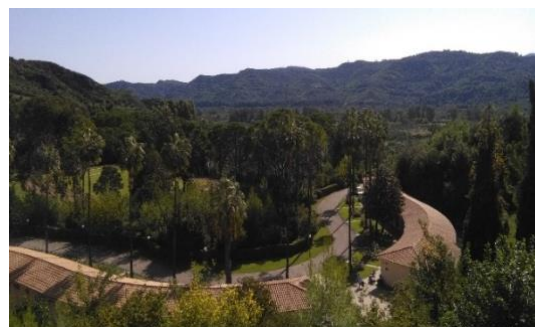
Instalaciones de la AOI, 2016