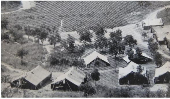
Campamento en la IOA, 1961

La primera sesión de la AOI se llevó a cabo en junio de 1961, donde 31 estudiantes de 24 países, nominados por sus comités olímpicos nacionales, participaron de la misma, pernoctando en carpas y recibiendo lecciones al aire libre.