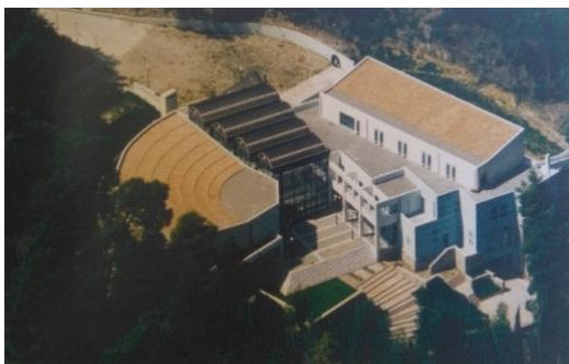
Centro de Conferencias AOI, 1996