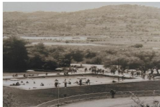
Piscina AOI, 1968