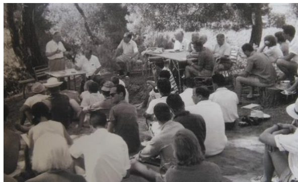
Conferencia en la IOA, 1961

Los primeros edificios de la AOI fueron terminados en 1967, con los años nuevas instalaciones se fueron agregando, es así que en 1994 el centro de conferencias de la fue inaugurado.